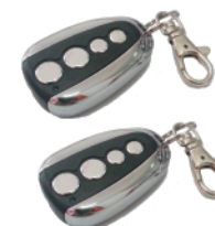
2 CONTROLES REMOTOS 433 MHz